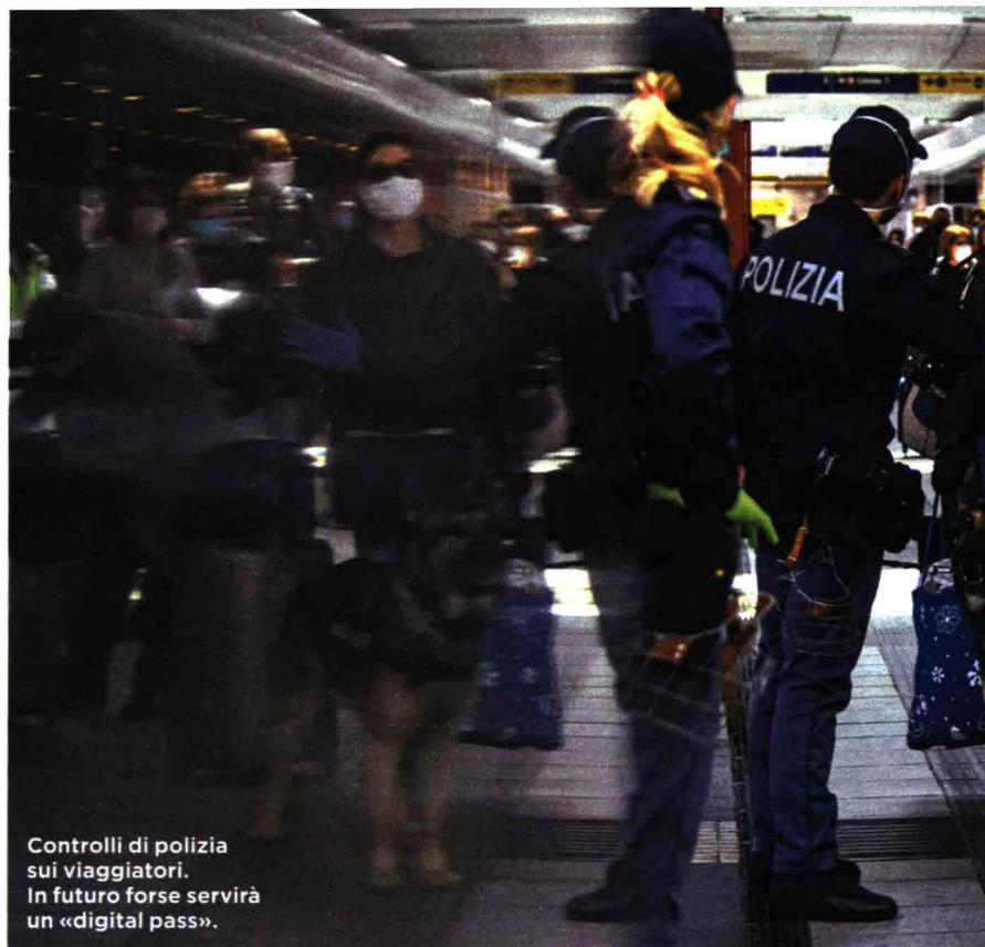
Controlli di polizia sui viaggiatori. In futuro forse servirà un «digital pass».

«Se Capri fosse Covid-free i turisti la sceglierebbero prima di Kastellorizo, questo è certo» commenta a Panorama Bernabò Bocca, presidente di Federalberghi. «Ma ormai oggi la discriminante sono i vaccini, c'è poco da fare. Ho chiesto al nuovo ministro del Turismo, Massimo Garavaglia, di concedere corsie