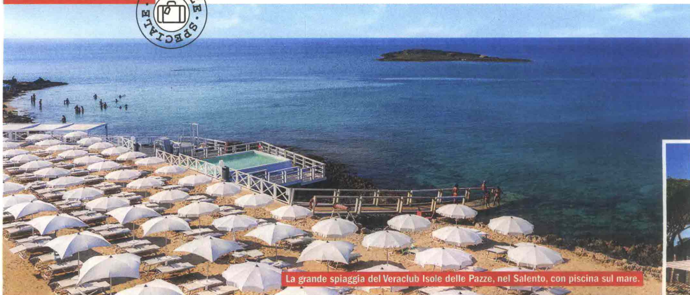
La grande spiaggia del Veraclub Isole delle Pazze, nel Salento, con piscina sul mare.