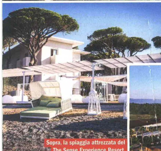
Sopra, la spiaggia attrezzata del The Sense Experience Resort, hotel eco-chic in Toscana. A destra, il grandioso Falkensteiner Club Garden Calabria, immerso in una pineta.