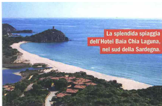
La splendida spiaggia dell'Hotel Baia Chia Laguna, nel sud della Sardegna.