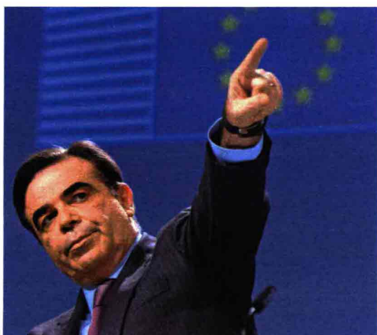
Margaritis Schoinas, vicepresidente Commissione Ue.

riscritte. Per noi non possono valere solo gli obblighi. Dobbiamo consentire alla gente di viaggiare, sennò muore l'Italia». È così: al 2019 il turismo reggeva l'Italia con il 13 per cento del Pil occupando 4,2 milioni di persone; nel 2020 si è calcolato un meno 53 miliardi di ricavi. E lo stesso accade ad altri Stati europei. Ma mentre (in un mondo ideale) dovremmo stare uniti intorno alla bandiera stellata, c'è