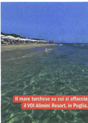
Il mare turchese su cui si affaccia il VOI Alimini Resort, in Puglia.