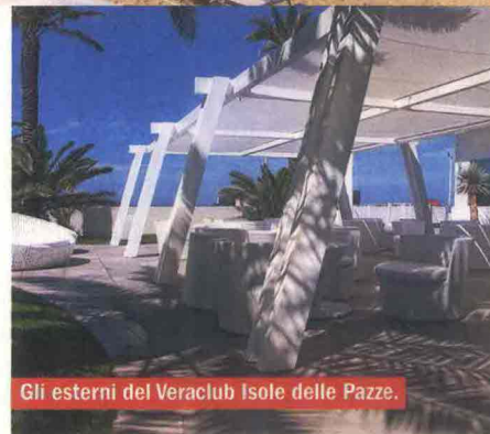
Gli esterni del Veraclub Isole delle Pazze.

➔ Info: The Sense , costo: a giugno, 2 adulti + 1 bambino (2-11 anni) in mezza pensione da 387.60 euro al